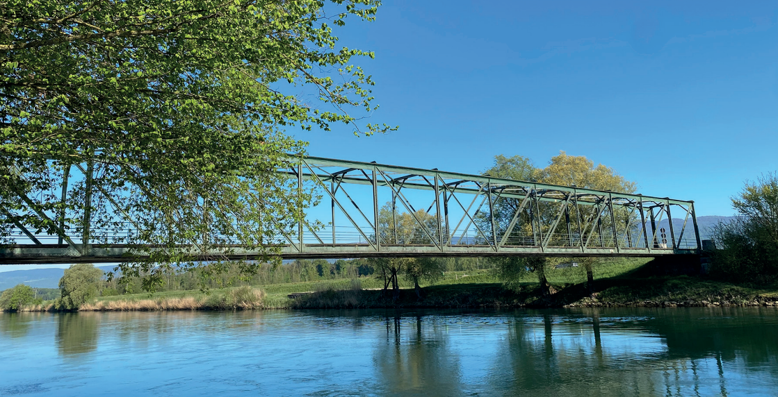
Die Brücke verbindet seit vielen Jahren die beiden Uferbereiche in Walperswil.

Die Walperswilbrücke gehört seit beinahe 150 Jahren zum Alltag vieler Menschen in der Region. Mit der bevorstehenden Sanierung wird dafür gesorgt, dass die sogenannte „Chlälälibrügg“ auch in Zukunft sicher genutzt werden kann und ihren charakteristischen Platz als Verbindung über den Hagneckkanal für Verkehr, Landwirtschaft und Freizeit behält.